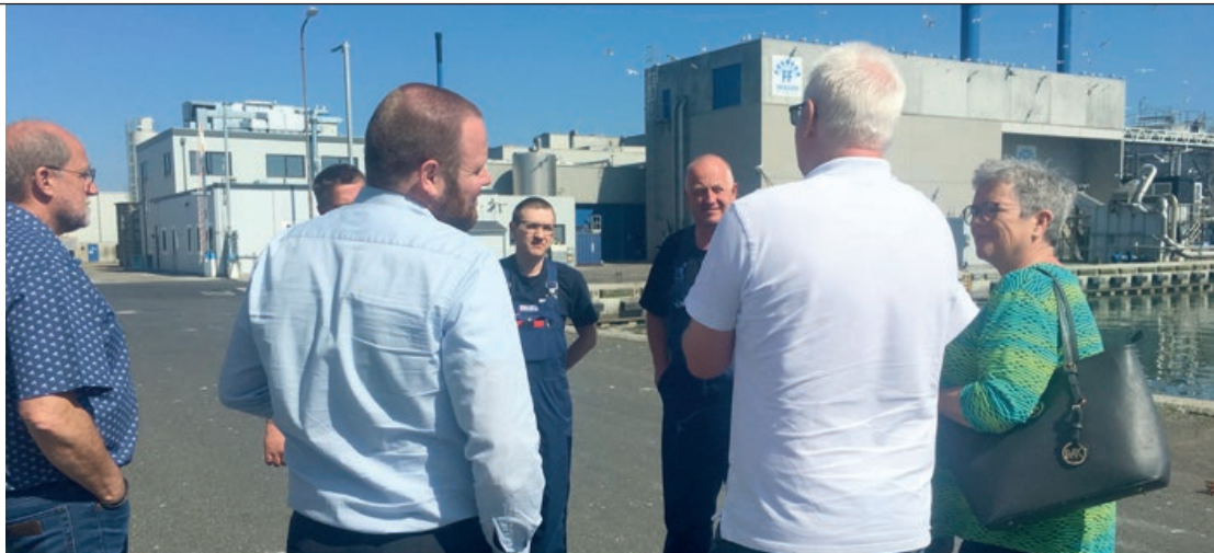
FAGET mødte på studieturen de ansatte fra Scandic Pelagic.

»Kan du ikke andet – så kan du altid komme i fisken«. Det kedelige image har fiskeindustrien i Skagen, Sæby og Hirtshals kæmpet med i mange år, og det har givet fiskeindustrien modvind, når der skulle findes nye medarbejdere.